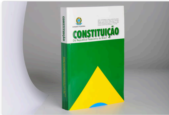
Constituição da República Federativa do Brasil - a 'Constituição Cidadã', promulgada em 1988.

O Brasil teve 7 Constituições: 1824, 1891, 1934, 1937, 1946, 1967/1969 e 1988. A CF/1988 foi elaborada pela Assembleia Constituinte (1987-1988), convocada após o fim da ditadura militar (1964-1985). Foi promulgada em 5 de outubro de 1988.